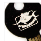
Grabado láser individual